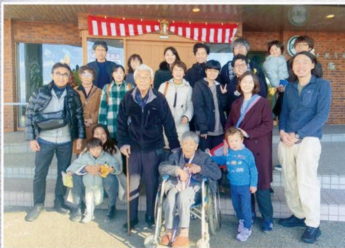
親族一同での南知多旅行

昭和7年2月15日、名古屋市東区生まれ。7人兄弟の6番目、三男です。在校生2千人ほどの筒井国民小學校に通い、学校には、奉安殿と名付けた建物があり、中には天皇・皇后陛下の御写真が飾ってありました。毎日、朝礼時に全員で挨拶をして各教室に入り、授業を受けていま