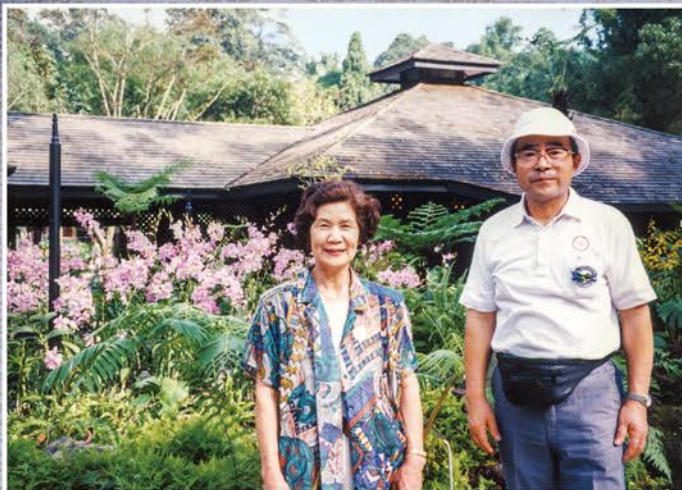
妻とのシンガポール旅行

貴重な体験を次世代へ伝えていくため「記録に残したい記憶」として、ひとりの方にスポットをあてて体験談をご紹介していきます。