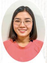
ファム ティ トウオン ビー ニックネーム ビー ひまわり邸 国籍:ベトナム